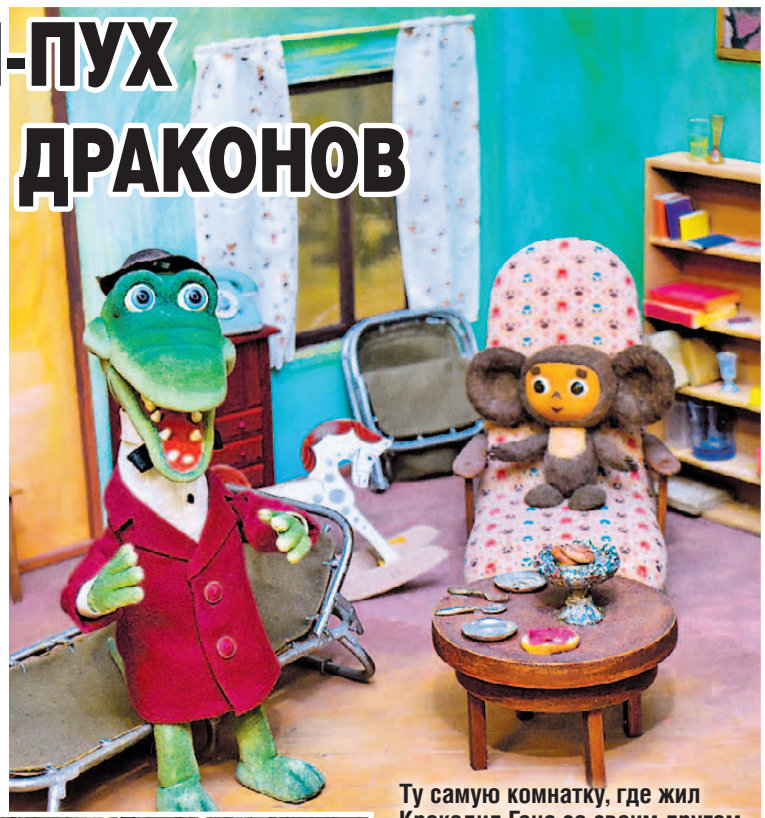
Ту самую комнатку, где жил Крокодил Гена со своим другом, можно увидеть теперь в музее.