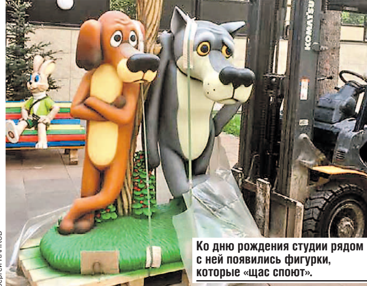
Ко дню рождения студии рядом с ней появились фигурки, которые «заспоят».

Кстати, голос актера Евгения Леонова тоже подошел мишке не сразу. Из-за того, что слишком глубокий. Но мультипликаторы пошли на хитрость, немного ускорили запись, и получилось то, что надо. С речью закадычного друга Винни, Пятачка, тоже связана интересная история. Ия Саввина призналась, что, озвучивая его, копировала манеру говорить знаменитой Беллы Ахмадулиной . Поэтесса не обиделась. Набрала номер Саввиной и остроумно заметила: «Спасибо, что вы