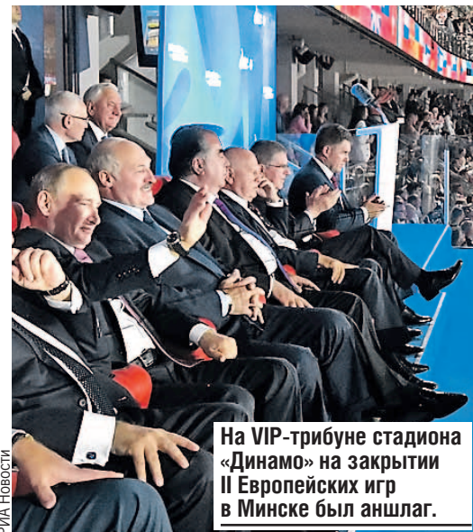
На VIP-трибуне стадиона «Динамо» на закрытии II Европейских игр в Минске был аншлаг.