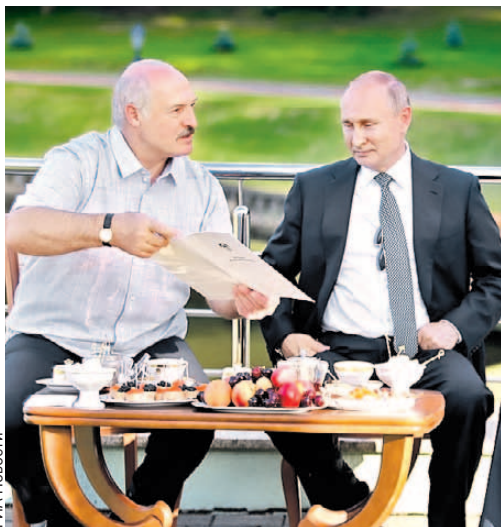
За чаем президенты обсудили и Союзный договор, и совместные проекты.

Александр Лукашенко уже не в первый раз катает Владимира Путина на автомобиле. В этот раз на электрокаре, а в прошлом году в Александрии - на раритетном УАЗике.