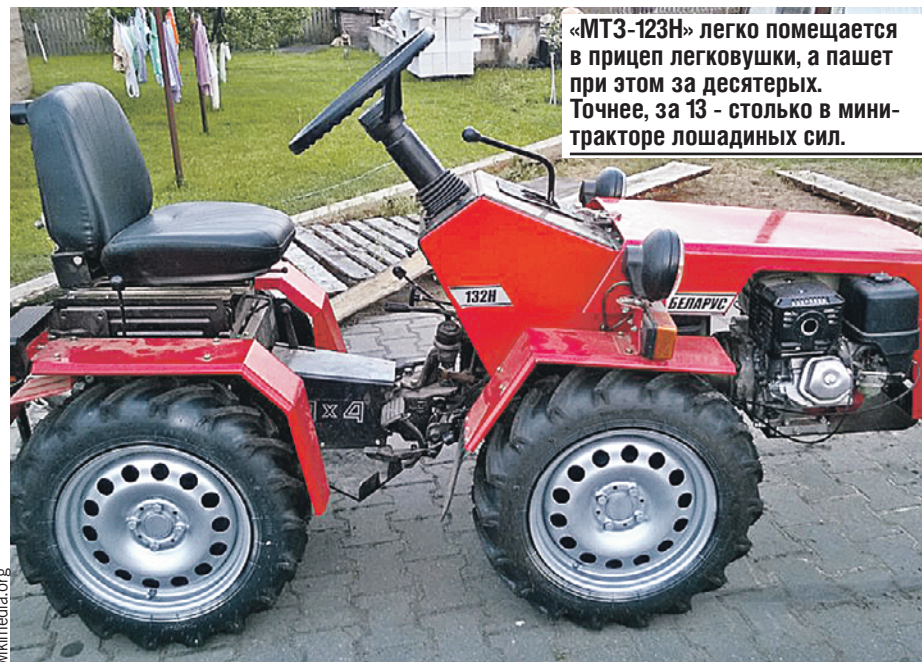
«МТЗ-123Н» легко помещается в прицеп легковушки, а пашет при этом за десятерых. Точнее, за 13 - столько в минитракторе лошадиных сил.

С 2002 года в Ростове-на-Дону проходят гонки на машинах производства МТЗ «Бизон-Трек-Шоу». Несмотря на то, что в них участвуют команды из России, Беларуси и других стран, все гоняют на «Беларусах». В последние годы соревнования собирают по сорок тысяч зрителей. Гонщикам нужно преодолеть одиннадцатикилометровую трассу с крутыми поворотами, трамплинами, препятствиями и скоростными участками.