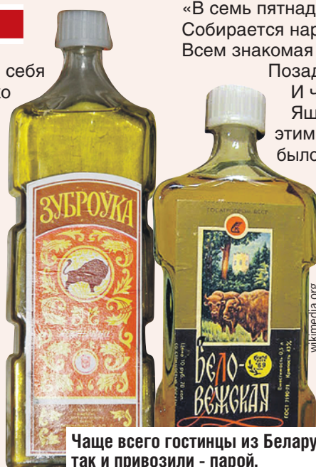
Чаще всего гостинцы из Беларуси так и привозили - парой.

Делать настойку на траве начали еще в XVI веке в Речи Посполитой, а спустя двести лет «Зубровка» была любимым напитком польской знати. К началу XX века изобрели способ массового производства, и она пошла в народ. Поначалу ее производили только в Бресте, когда он был еще польским городом.