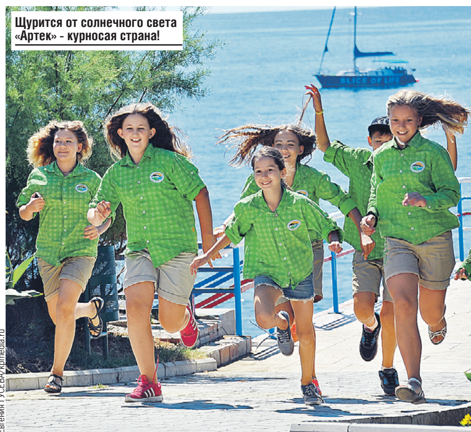
Щурится от солнечного света «Артек» - курносая страна!

Практикуют такого рода поощрения и крупные частные компании - включают как бонус в комплексный социальный пакет своих сотрудников.