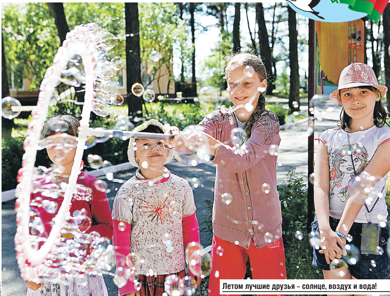
Летом лучшие друзья - солнце, воздух и вода!

Многие крупные белорусские предприятия сохранили детские оздоровительные центры. Как, например, МАЗ, лагерь которого называется «Зубренок». Не тот, что на Нарочи, а под Минском.