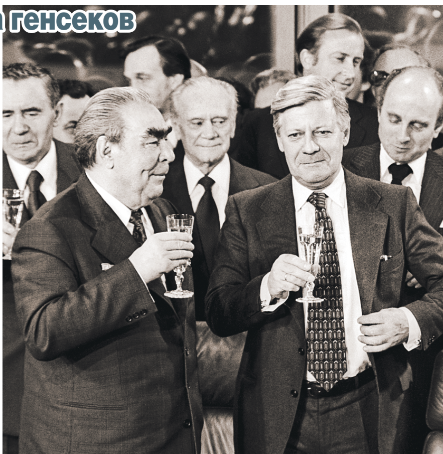
Леонид Ильич с удовольствием угощал «Зубровкой» коллег. Но после протокольного бокала с шампанским и в более неформальной обстановке.

Ослушаться было невозможно, и к егерю послали технологов с ближайшего ликеро-водочного завода.