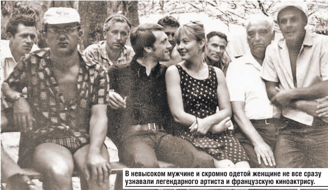
В невысоком мужчине и скромно одетой женщине не все сразу узнавали легендарного артиста и французскую киноактрису.