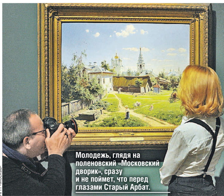
Молодежь, глядя на поленовский «Московский дворик», сразу и не поймет, что перед глазами Старый Арбат.