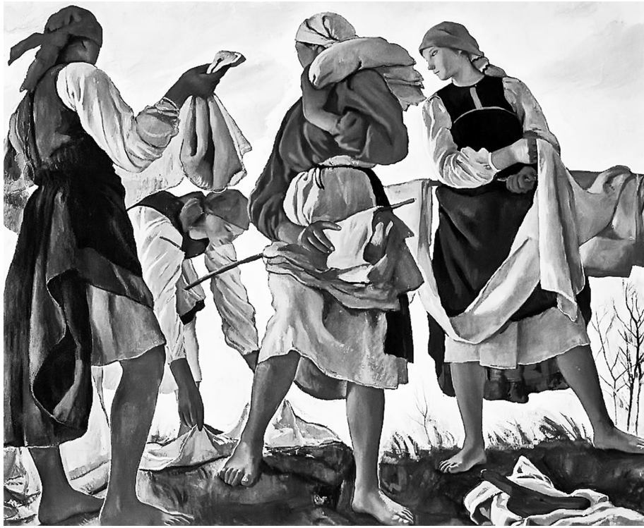
Беление холста. 3. Серебрякова

Рубеж XIX и XX столетий в России – время, открывшее много талантов, породившее расцвет искусств и новые течения, которые оказывали влияние на всю мировую культуру.