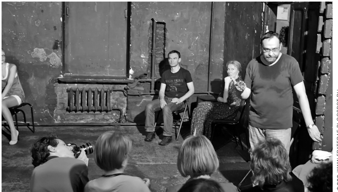
Брифинг после спектакля «Час восемнадцать».