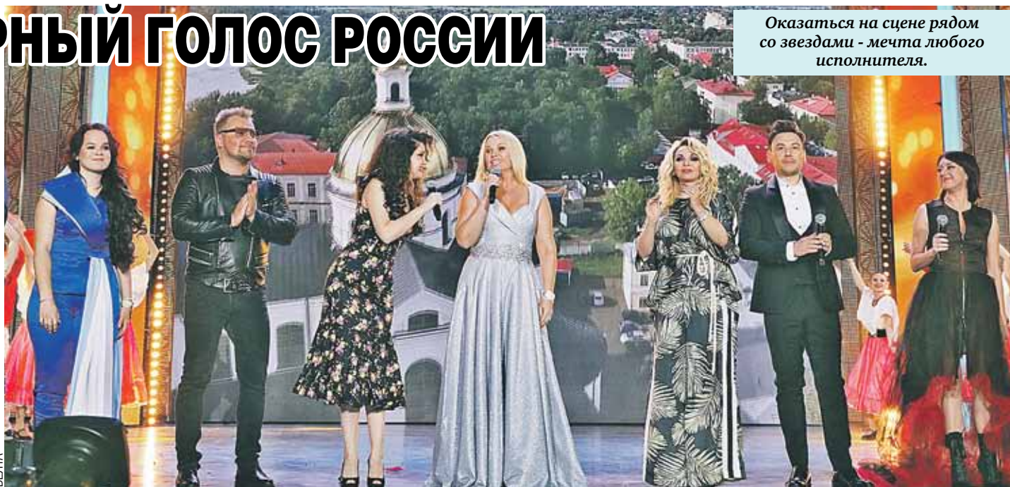
Оказаться на сцене рядом со звездами - мечта любого исполнителя.