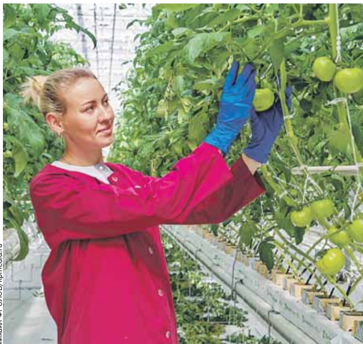
Задача на перспективу - обеспечивать себя продукцией не только в межсезонье, а круглый год.

Лесное хозяйство Беларуси на протяжении последних десятилетий развивается инно-