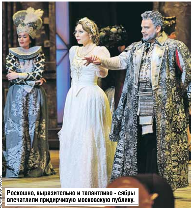
Роскошно, выразительно и талантливо - сябры впечатлили придирчивую московскую публику.

Премьера состоялась недавно - в 2020 году. Во многом спектакль получился таким благодаря личности автора постановки Валентина Елиза-