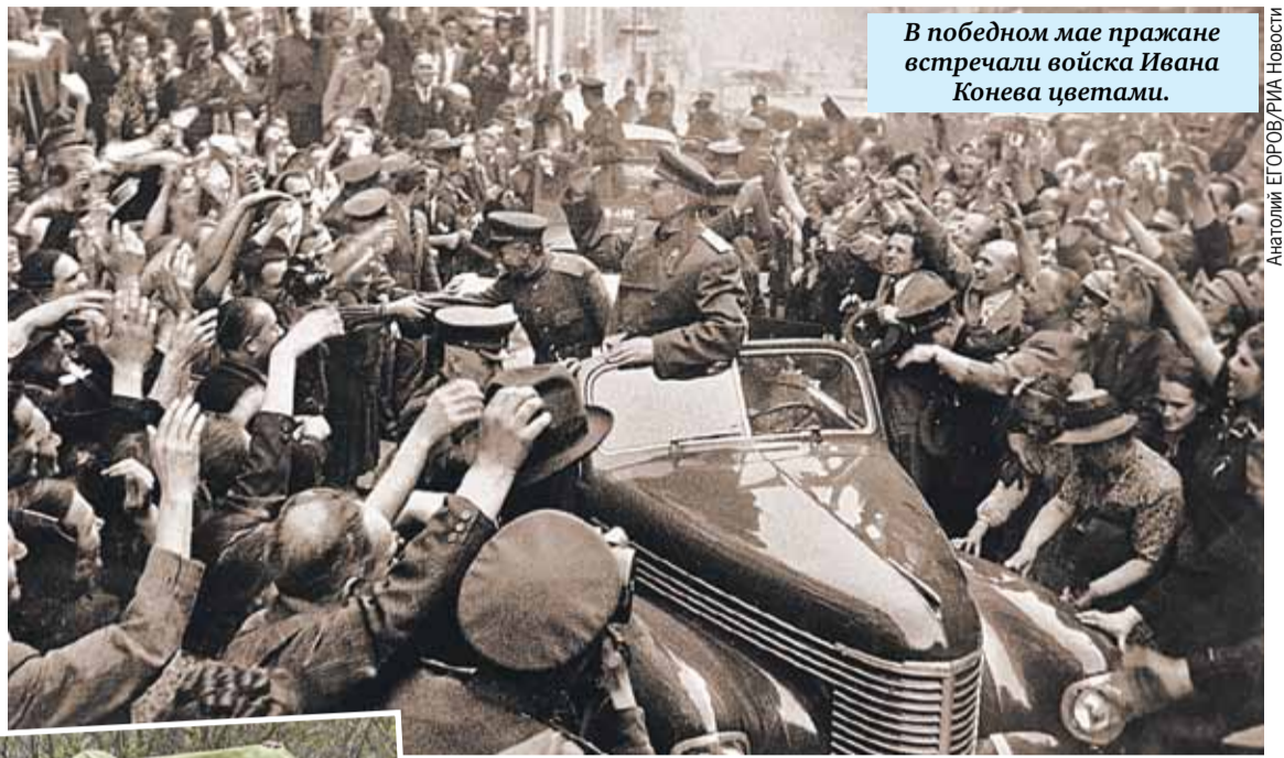
В победном мае пражане встречали войска Ивана Конева цветами.

- Битва за Москву. Папе досталась в ней самая тяжелая ноша, северный фас обороны столицы - сражение за Калинин, нынешнюю Тверь. После того как Гудериан остановили под Тулой, немцы именно здесь, на севере, бросили в наступление огромную массу танков. Стоять надо было на-