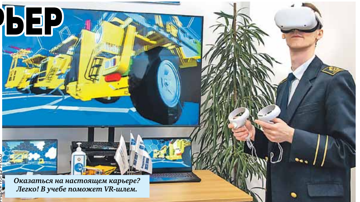
Оказаться на настоящем карьере? Легко! В учебе поможет VR-шлем.

- Мы очень рады возможности поработать с таким авторитетным вузом, как Санкт-Петербургский горный университет, - сказал первый заместитель гендиректора