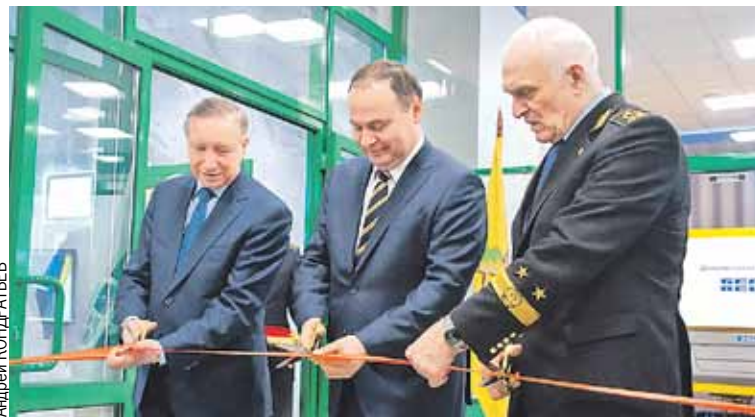
Ленточку торжественно разрезали губернатор Петербурга Александр Беглов, премьер Беларуси Роман Головченко и ректор университета Владимир Литвиненко (слева направо).

БелАЗа Александр Ботвинник. - Для нас это механизм по повышению компетенций клиентов. Также центр поможет привлечь к нам в компанию перспективные кадры. Его открытие подтверждает, что российско-белорусское партнерство развивается и имеет огромный потенциал для роста.