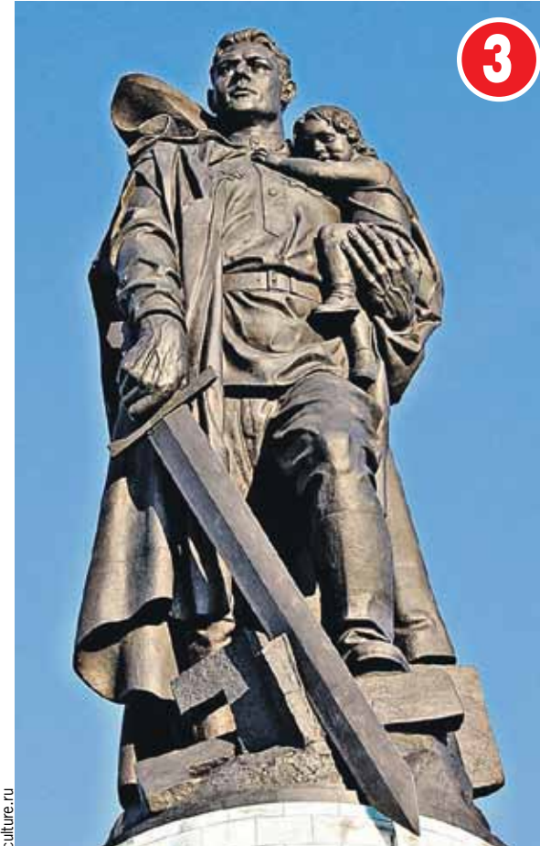
Для комплекса в Трептов-парке не хватало материалов. Проблема решилась, когда нашли немецкий склад с ценным камнем, предназначавшимся для отделки сооружения в честь несостоявшейся победы над СССР.