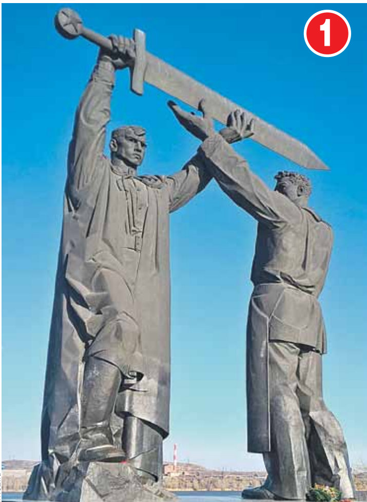
Положение фигур тоже имеет смысл. Рабочий обращен на восток, в сторону металлургического завода, а боец смотрит на запад, откуда пришла угроза Родине.