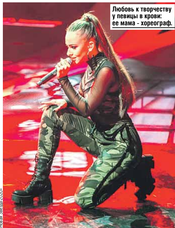
Любовь к творчеству у певицы в крови: ее мама - хореограф.