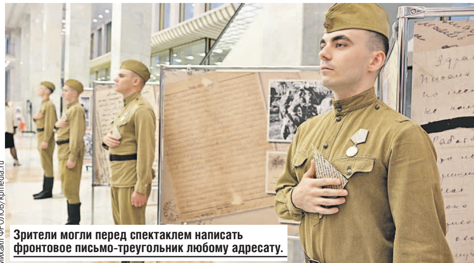
Зрители могли перед спектаклем написать фронтовое письмо-треугольник любому адресату.

Сегодняшний концерт - это живое напоминание нам всем о важности сохранения исторической памяти, о том, что мы должны всегда помнить и наших героев, и жертв немецко-фашистской оккупации.