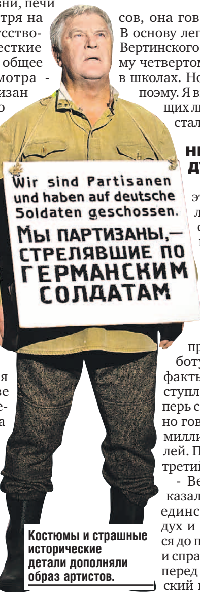
Костюмы и страшные исторические детали дополняли образ артистов.

- Есть действующие лица, которые проживают в определенном сюжете, - говорит режиссер Владислава Артюковская . - В финале они становятся памятниками. И это специально сделано, потому что мы все посещаем памятные места, но никогда, мне кажется, молодежь особенно не задумываемся, что это значит. И мне захотелось обратить на это внимание. Чтобы теперь, когда ребята будут возлагать цветы к определенным памятникам, понимали, что этот монумент обозначает, кто эти люди, увековеченные там. И мы говорим о том, что они были реальные.