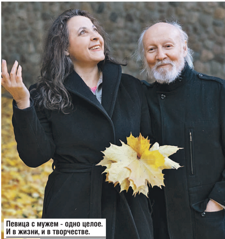
Певица с мужем - одно целое. И в жизни, и в творчестве.

Как я - вокалист - должна в этом разбираться? В музыке важна слышимость, как начитанность в книгах и насмотренность в кино. Я учусь