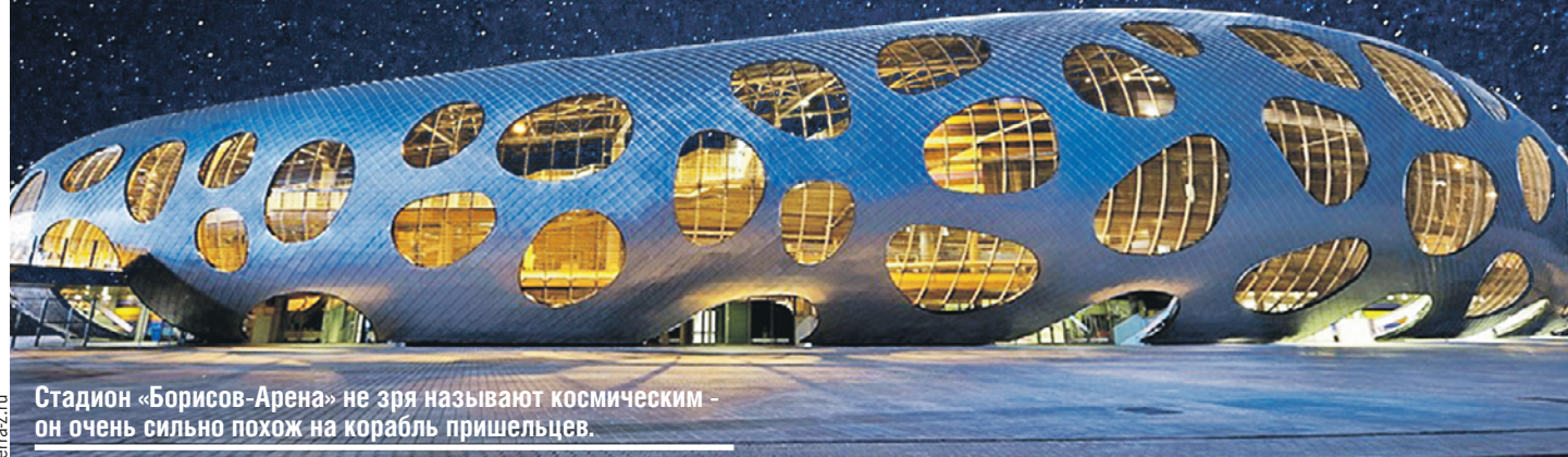
Стадион «Борисов-Арена» не зря называют космическим - он очень сильно похож на корабль пришельцев.

разных стран и проводят масштабную реконструкцию переправы наполеоновских войск.