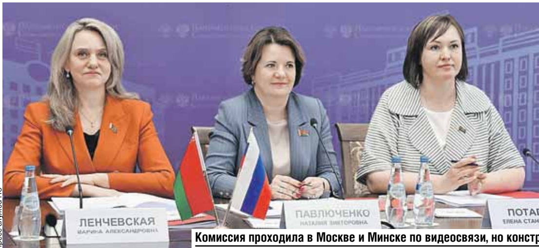
Комиссия проходила в Москве и Минске по видеосвязи, но конструктивному разговору это не мешало.