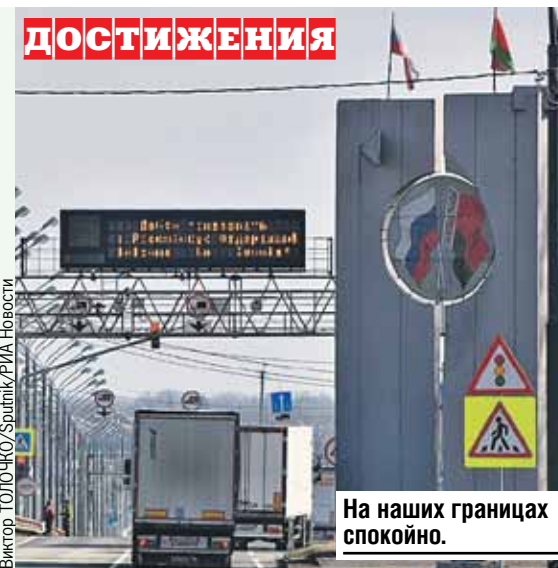
На наших границах спокойно.

сложившиеся в рамках Союзного государства: Форум регионов, совместные рабочие группы. Его уже положительно оценили в исполкомах Витебской, Гомельской, Могилевской областей, и администрациях трех российских регионов: Брянской, Псковской и Смоленской.