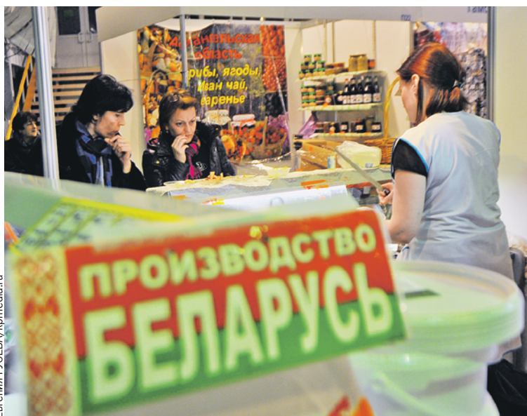
В магазинах продукты из республики пользуются большим спросом. А значит, и мошенники, желающие на этом нажиться, найдутся.