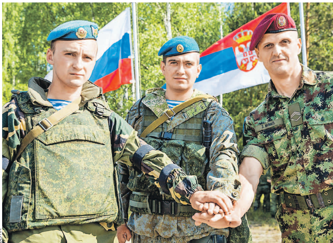
«Никто, кроме нас!» - девиз десантников всех стран.

Из России в Брест приехали триста десантников с самым современным оружием. Их экипировали в комплекты солдата будущего «Ратник». А повезут летучую гвардию боевые ма-