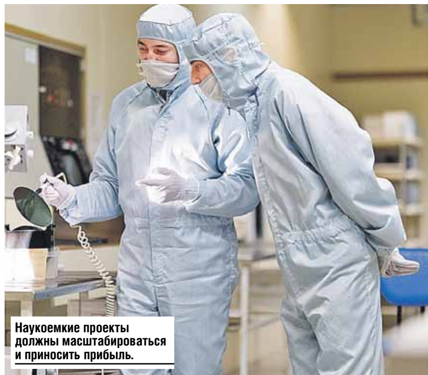
Научные проекты должны масштабироваться и приносить прибыль.

Меня немного озадачили выступления некоторых коллег, которые смотрели на наш союз с точки зрения третьего элемента: Россия, Беларусь и Союзное государство. От такого подхода нужно уходить. И еще. Например, построили мы на деньги из общей казны предприятие, допустим, на российской земле. А по нашему законодательству налоги нужно платить по месту расположения. Но кто должен это делать? Ведь мы строили завод в складчину. Вопрос проблемный, которые также требует взвешенного решения.