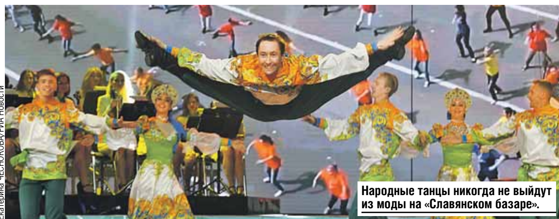
Народные танцы никогда не выйдут из моды на «Славянском базаре».

Впервые слышит про программу «Славянского базара»