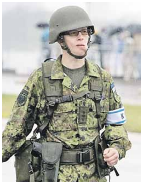
Прибалтика пригрозила, что готова послать вот такие войска в Незалежную. Страшно, аж жуть!

Раскрыл рот и министр обороны еще недавно нейтральной Швеции Пол Йонсон.