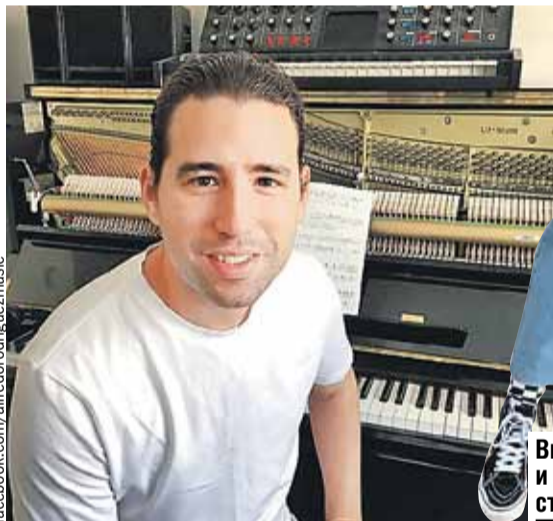
Вместе с кубинцем и южноафриканкой станет жарче.

Организаторы ждут в первую очередь семьи с детьми.