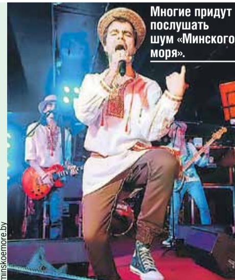
Многие придут послушать шум «Минского моря».

Вечер первого дня завершится большим фейерверком, а после еще и дискотека. В числе тех, кто примет участие