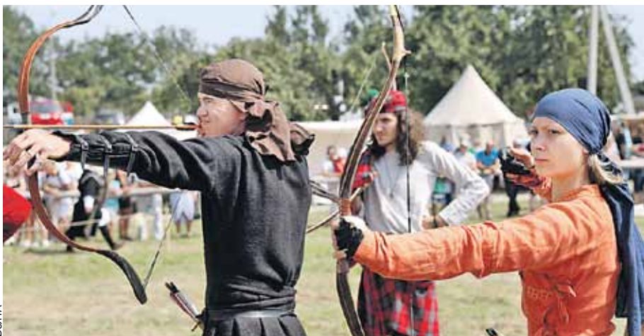
Рыцарский фестиваль в Мстиславле собирает тысячи любителей средневековой культуры. В этом году он пройдет 6 - 7 августа.

Мстиславская земля щедра на археологические подарки. Замковую гору и ее окрестности не одно десятилетие изучают историки. Здесь находили ювелирные украшения, предметы быта и даже рыцарские доспехи. Гора уже стала своеобразным музеем под открытым небом, где под деревянным частоклом припрятали остатки древнего города. А современный Мстиславль в первый выходной августа собирает тысячи реконструкторов из разных стран на знаменитый «Рыцарский фестиваль».