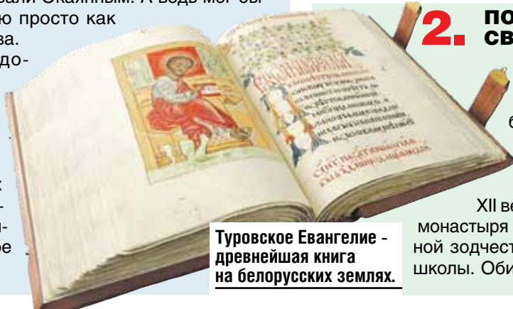
Туровское Евангелие - древнейшая книга на белорусских землях.

Археологи доказали: город был богат экономически и духовно. Здесь создали один из древнейших памятников славянской письменности - Туровское Евангелие.