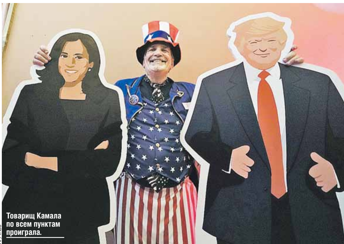
Товарищ Камала по всем пунктам проиграла.