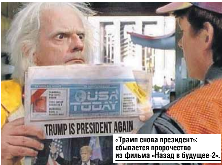
«Трамп снова президент»: сбывается пророчество из фильма «Назад в будущее-2».

разом, обе палаты Конгресса будут теперь с республиканским большинством - стали властью законодательной и исполнительной. «Синие» демократы больше не смогут пропихнуть свои законы.