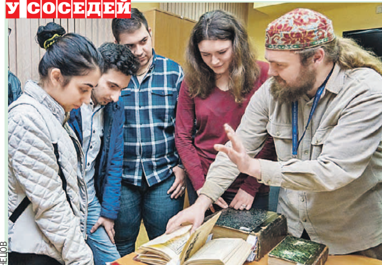
Молодежь, выросшая на электронных книгах, с интересом рассматривает красочные вековые «першадруки» (старинные книги. - бел.).