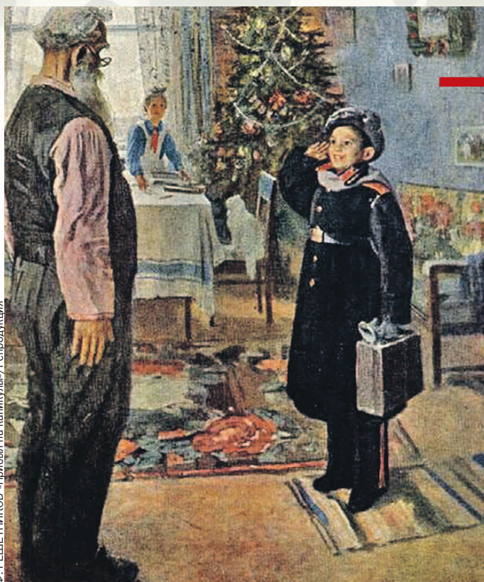
Довольный кадет с картины «Прибыл на каникулы» служит укором и примером для бедолаги на полотне «Опять двойка».

«Опять двойка» промелькнула, наверное, в жизни каждого советского ученика. Нравоучительное полотно приглянулось составителям школьной программы. Ре-