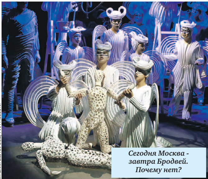
Сегодня Москва - завтра Бродвей. Почему нет?

при Музее изобразительных искусств имени Пушкина . За четыре года ему предстоит познакомиться с историей живописи и скульптуры, начиная с Древнего мира и до современных направлений. А заодно примерить на себя роли кураторов выставок, экскурсоводов и даже авторов художественных квестов. И, разумеется, поближе познакомиться с современными художниками и скульпторами. На месте си-