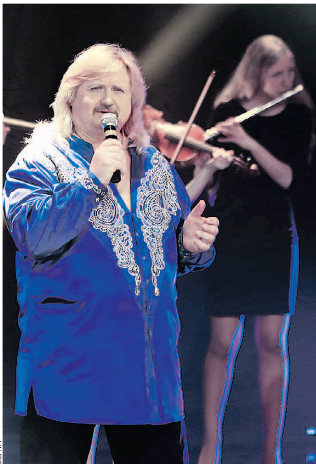
На концертах Валерий часто поет вместе с залом любимые хиты - «Беловежскую пуцу», «Вологду», «Берёзовый сок», «Косил Ясь конюшину» и другие.