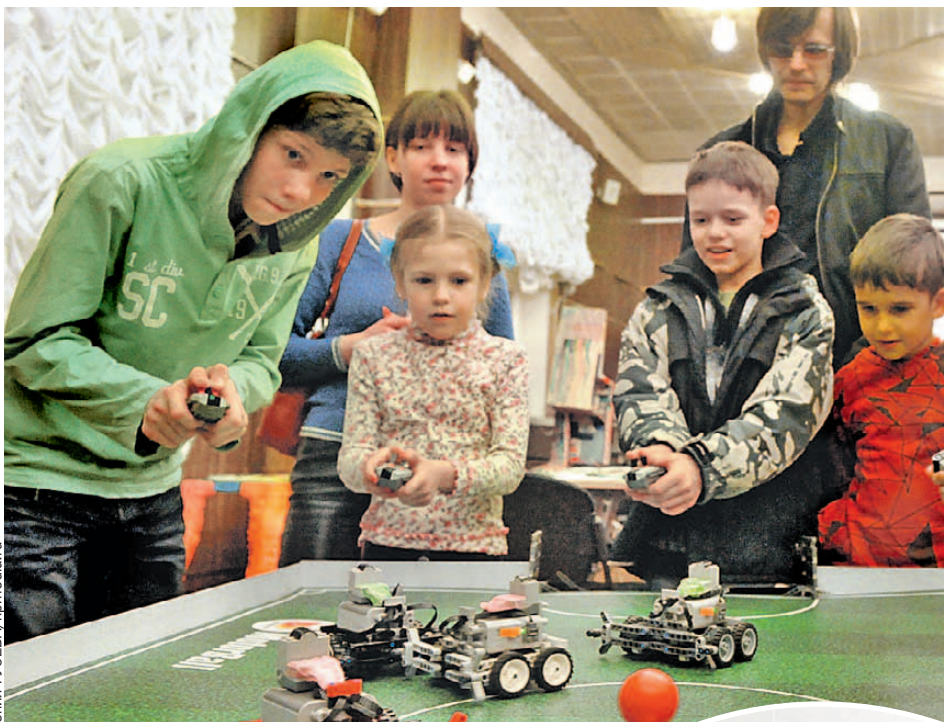
Вовсе это не игрушки - это радиоуправляемые, запрограммированные «танкоботы»! Как тебе такое, Илон Маск?

Если для ребенка имени Анны Нетребко и Ильдара Абдразакова не пустой звук, значит, с юных лет он влюблен в оперу. И, кто знает, возможно, мечтает однажды выйти на сцену Большого театра или Метрополитен-опера. Нет ничего недостижимого. При Детском музыкальном театре имени Натальи Сац работает оперная студия. Обучают истории театра, сценическому движению и танцу, актерскому мастерству, вокалу и музыкальной грамоте. Не в сухой теории, а на практике. Тут же знакомят с работой цехов, учат вживаться в образ и работать на сцене. Результат можно увидеть в десятке с лишним спектаклей, в которых заняты ребята - от знаменитых «Синей птицы» и «Щелкунчика» до «Мадам Баттерфляй» и «Кармен». Вышедший пару лет назад мюзикл «Приключения Оливера Твиста» и вовсе поставлен был на студийцев - они там главные звезды. Учат бесплатно, зачисляются по итогам прослушивания. Спрашива-