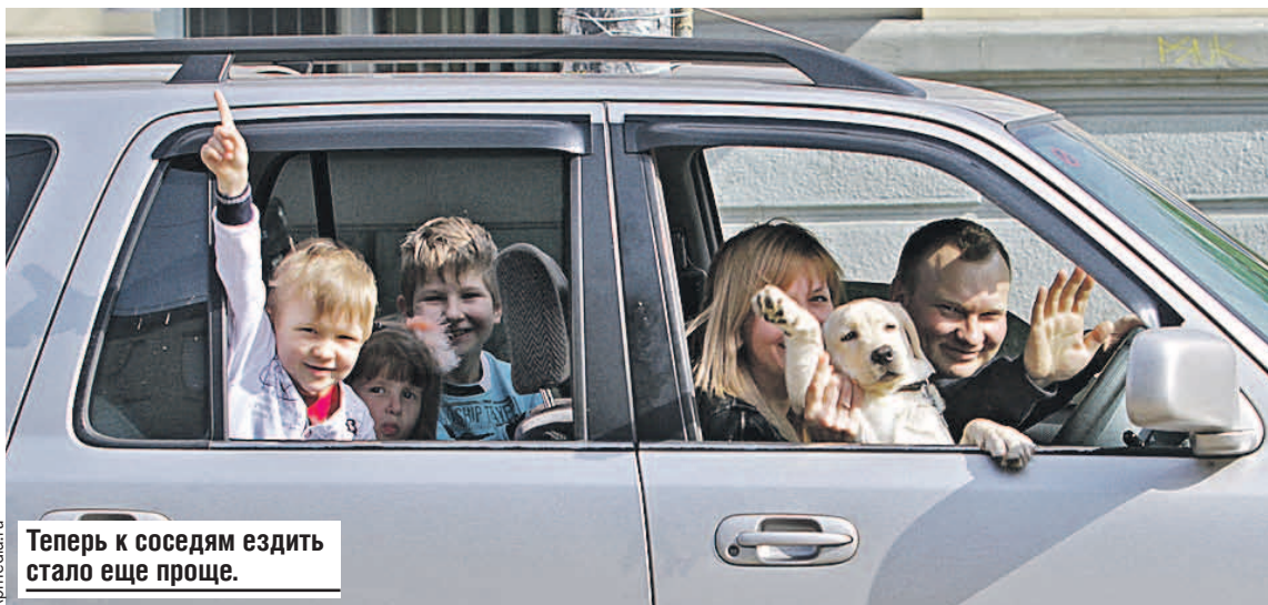
Теперь к соседям ездить стало еще проще.

Раньше у автомобилистов были дополнительные хлопоты. Отправляясь, например, из белорусской столицы в Смоленск, водитель был вынужден тормозить у страхового павильона и покупать «зеленую карту». Лишнее время и деньги. Устранять барьеры начали в 2021 году. Союзные депутаты работали над сближением законодательств двух стран, приво-