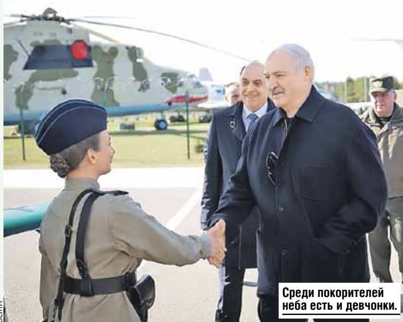
Среди покорителей неба есть и девчонки.

около 45 тысяч в год. Президент и сам в свое время обучался именно в автошколе ДОСААФ.