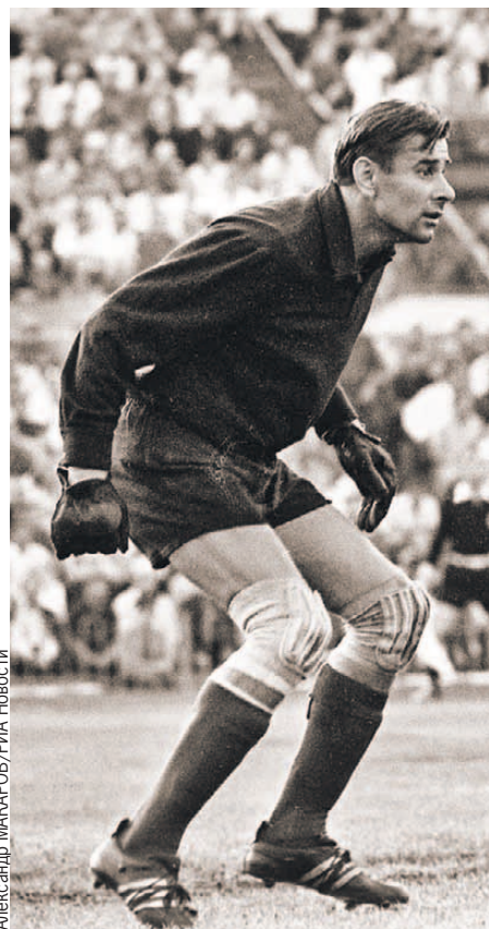
Яшин создал вратарский стиль, который существует до сих пор.

Вечером того же дня сообщение о пропаже несколько раз передали по местному радио. Диктор вежливо обращался к анонимному похитителю с просьбой вернуть советскому голкиперу его головной убор. Взамен Лев Иванович обещал подарить свой вратарский свитер. И представьте, на следующее утро в холле гостиницы, где квартировала сборная СССР, появился человек в форме полицейского и, робко переминаясь, протянул Яшину его чудо-кепку. Уговор есть уговор. Сияющий от счастья страж порядка получил в подарок яшинский свитер, но уже после финала, в котором сборная СССР победила Югославию.