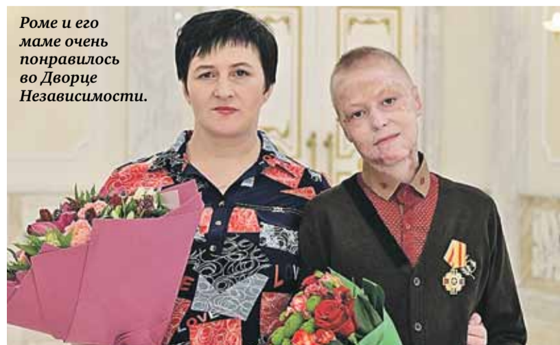
Роме и его маме очень понравилось во Дворце Независимости.