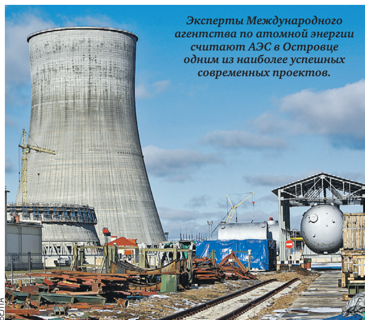
Эксперты Международного агентства по атомной энергии считают АЭС в Островце одним из наиболее успешных современных проектов.