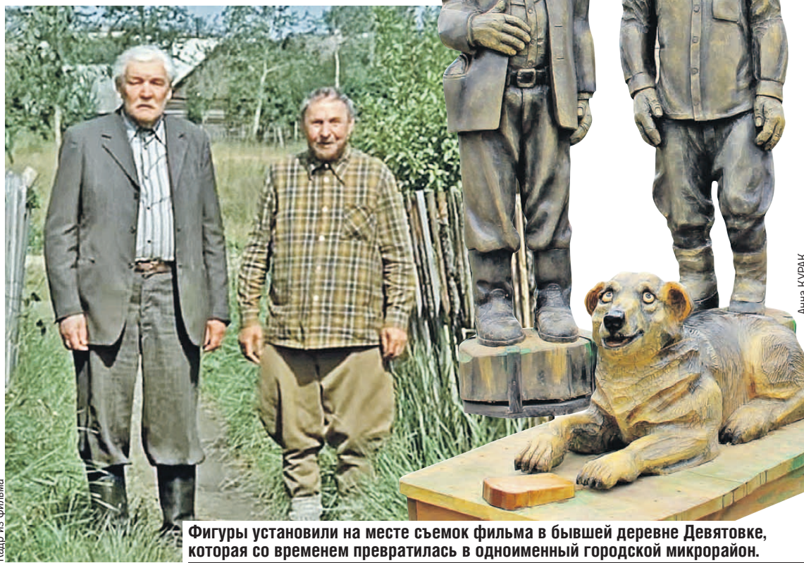
Фигуры установили на месте съемок фильма в бывшей деревне Девятówki, которая со временем превратилась в одноименный городской микрорайон.

личные прочные скульптуры. Стояли бы десятилетиями на улице и не портились. Не зря из лиственницы пол-Венеции отстроили. У тополевых скульптур век короче - максимум лет шесть. Дождь, снег и морозы рано или поздно сделают свое дело. Было бы неплохо соорудить для