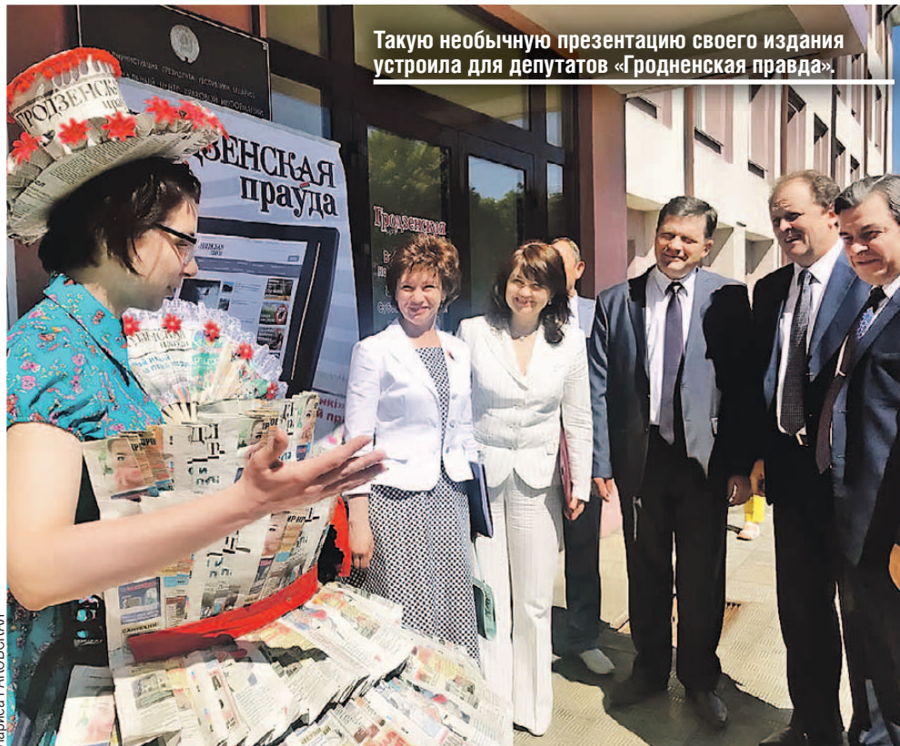
Такую необычную презентацию своего издания устроила для депутатов «Гродненская правда».

тра города. Интерактивные технологии позволяют представить, каким город был в разные эпохи, увидеть главные его достопримечательности, многие из которых утрачены.