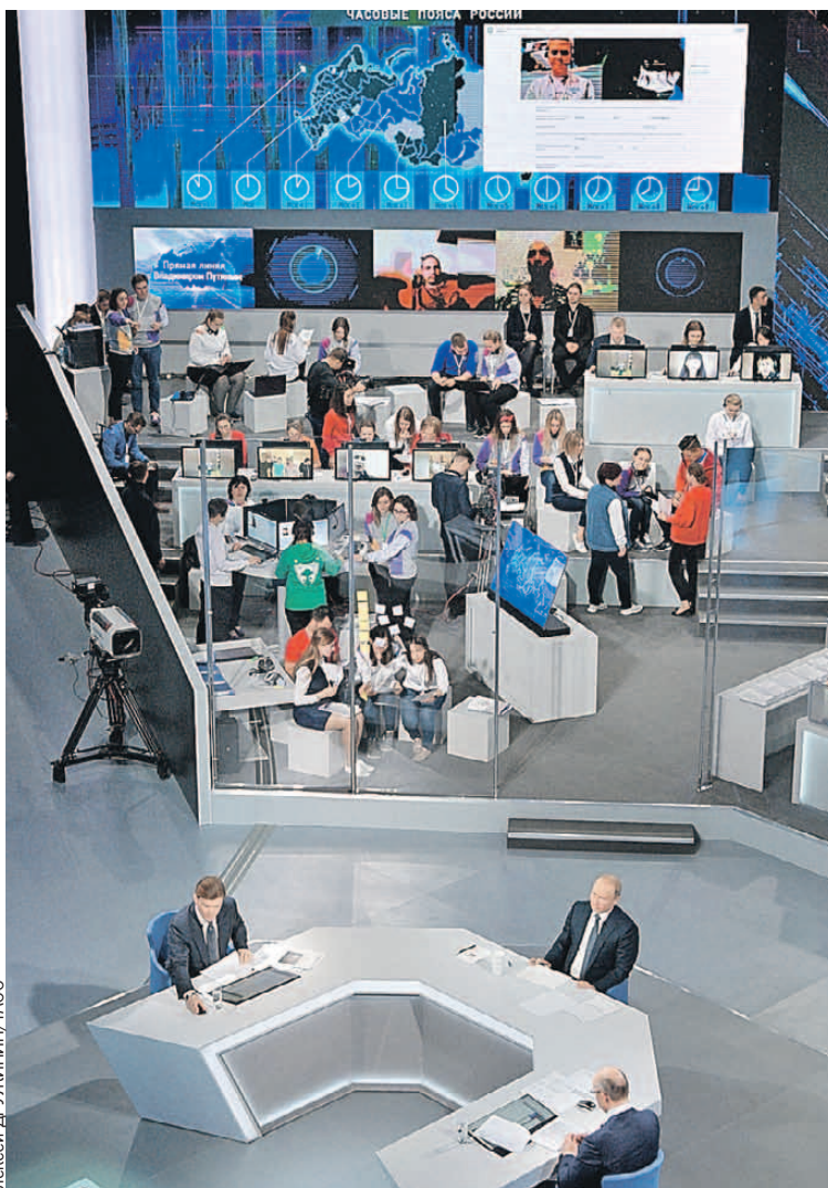
В этом году в телестудию решили не приглашать гостей, чтобы как можно больше вопросов прозвучало из регионов. Президент отвечал на них 4 часа 20 минут.