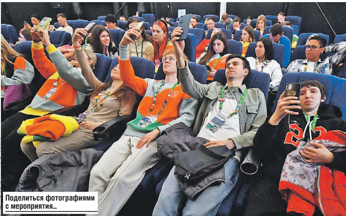
Поделиться фотографиями с мероприятия...