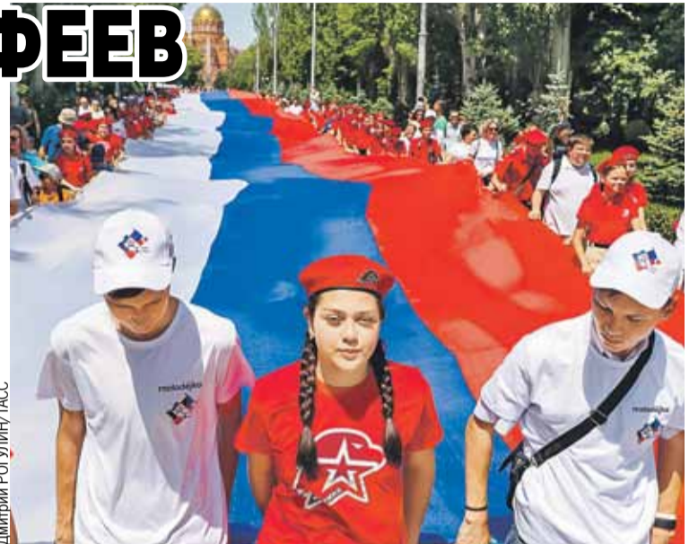
Участники акции «Бессмертный полк. Наши Герои» пронесли по Волгограду гигантский триколор.

Цветами российского триколора горел небоскреб Дубая Бурдж-Халифа, в Тель-Авиве угощались на улице русской кухни, и даже в Брюсселе Писающего мальчика одели в костюм русского grenадера. Праздник отмечали по всей планете.