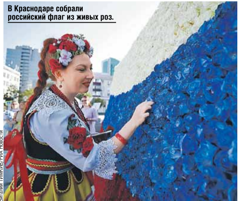
В Краснодаре собрали российский флаг из живых роз.