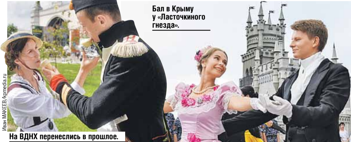
Бал в Крыму у «Ласточкиного гнезда».