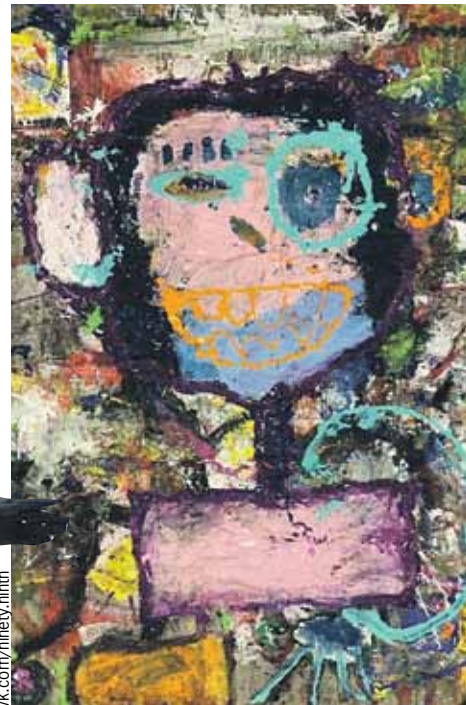
Некоторые свои работы спортсмен продает за пятьсот долларов.

На льду он - одиночник, зато в творчестве настоящий многостаночник.