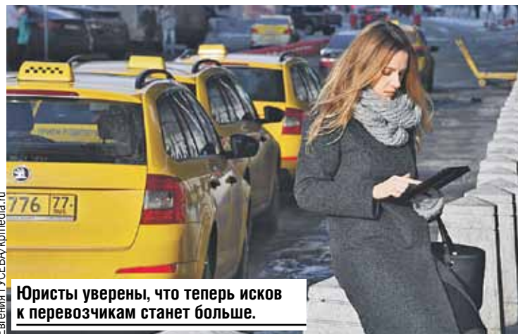
Юристы уверены, что теперь исков к перевозчикам станет больше.

сты, ответственность за то, что происходит с пассажирами в дороге, по закону давно несут агрегаторы. При этом большой судебной практики по таким делам нет. Почему? Традиционно граждане и юристы предъявляли такие иски лишь к водителям.