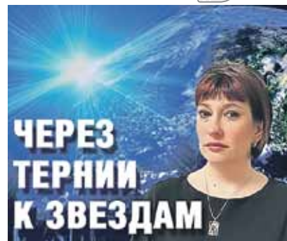
ЧЕРЕЗ ТЕРНИИ К ЗВЕЗДАМ