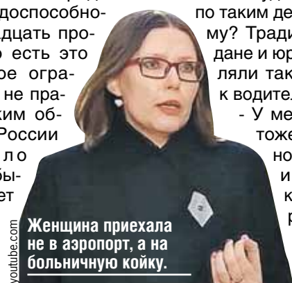
Женщина приехала не в аэропорт, а на больничную койку.

Выходной скафандр весит ни много ни мало сто четырнадцать килограммов. На командире обычно надет скафандр с красными лампасами, а на бортинженере - с синими. Кстати, очень удобно во время видеотрансляции - сразу понимаешь, кто перед тобой.