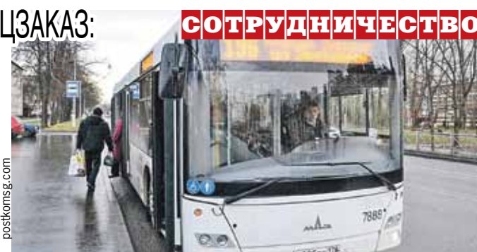
Низкопольный транспорт соответствует всем стандартам «доступной среды».

Уже в самое ближайшее время петербургское предприятие «Пассажиравтотранс» сможет на практике реализовать идею так