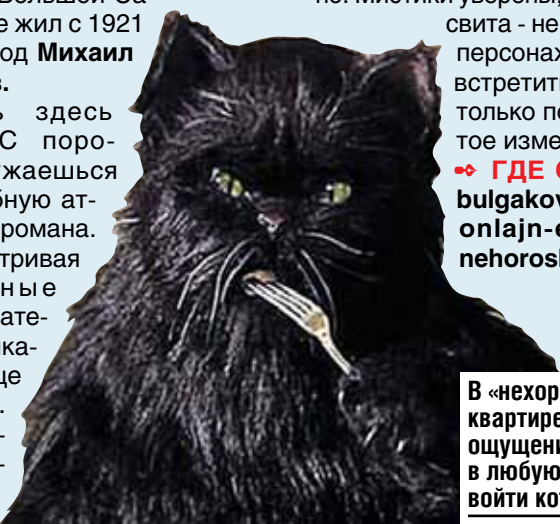
Кадр из фильма «Мастер и Маргарита»

Теперь здесь музей. С порога погружаешься в волшебную атмосферу романа. А рассматривая подлинные вещи писателя, проникаешься еще больше. Вот длинная книжная пол-