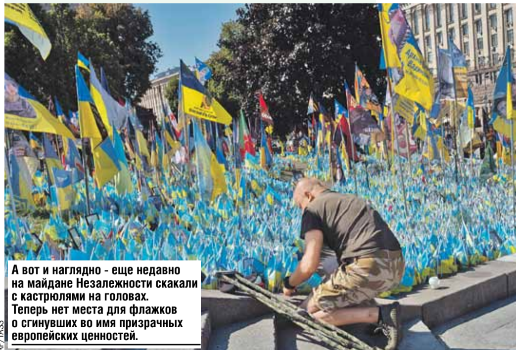
А вот и наглядно - еще недавно на майдане Незалежности скакали с кастрюлями на головах. Теперь нет места для флажков о сгинувших во имя призрачных европейских ценностей.

С высокой скоростью несется вся страна в тартарары. А мужики стремительно и качественно исчезают - осталось недолго воевать до последнего украинца, как хотят в Европе.