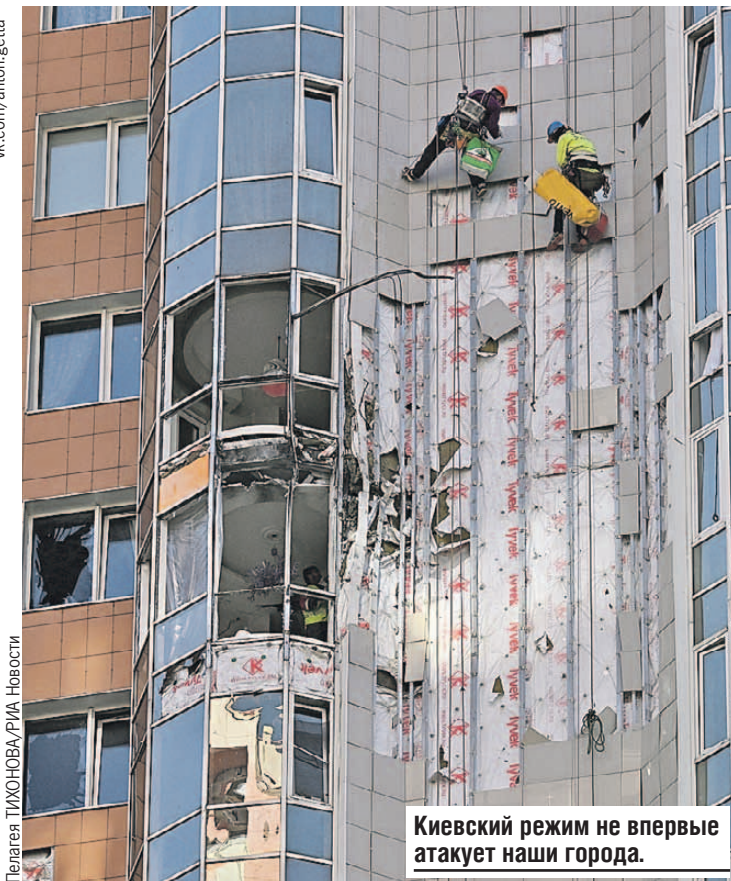
Киевский режим не впервые атакует наши города.

Леонид СЛУЦКИЙ, член Комиссии ПС по международным делам, миграционной политике и связям с соотечественниками: