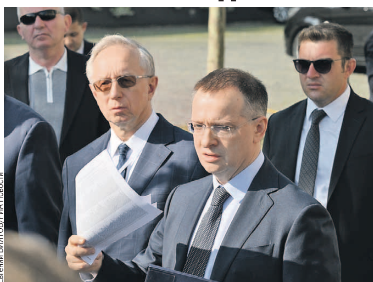
Владимир Мединский рассказал журналистам, что РФ передаст тела погибших солдат ВСУ без всяких условий.

В официальной стенограмме этого не было, но инсай-