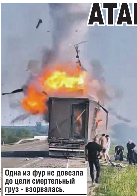
Одна из фур не довезла до цели смертельный груз - взорвалась.