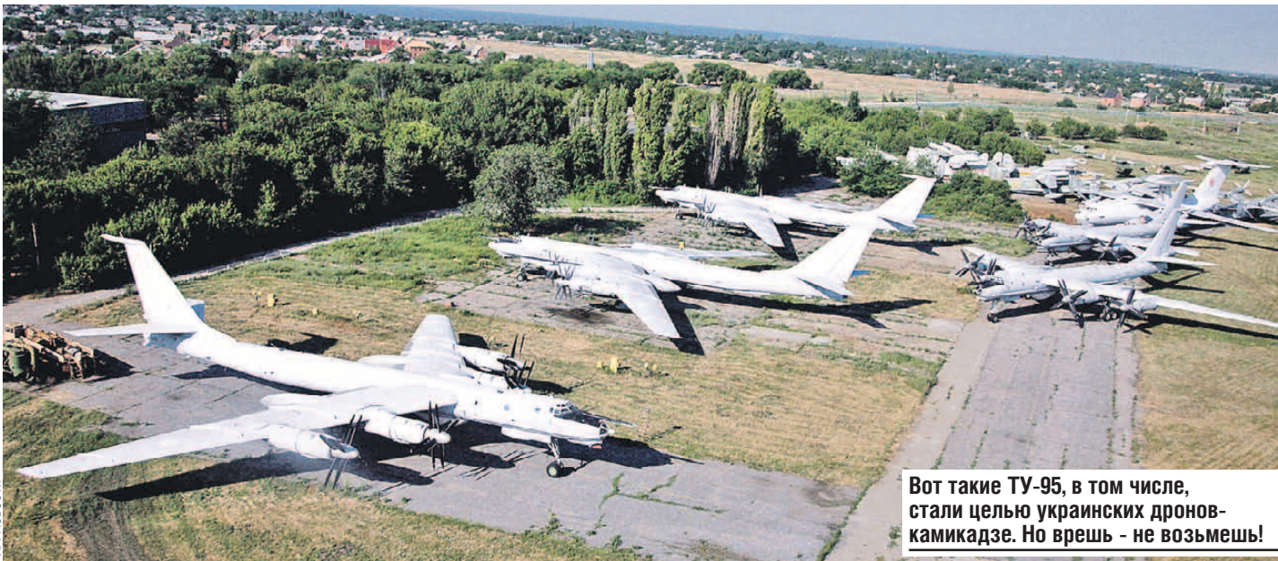
Вот такие ТУ-95, в том числе, стали целью украинских дрон-камикадзе. Но врешь - не возьмешь!