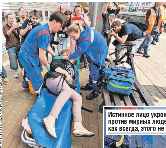
Агентство городских новостей «Москва»