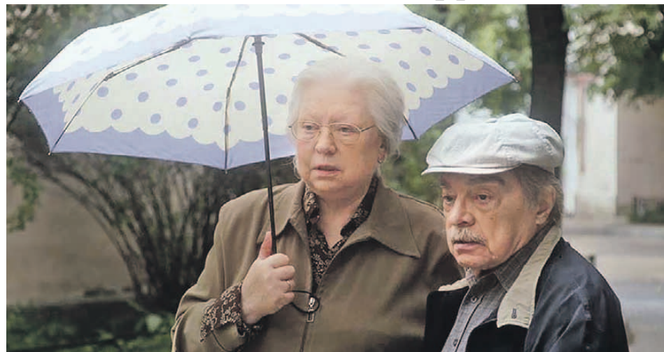
Со Светланой Крючковой в фильме «Двое в одной жизни, не считая собаки» им удалось показать мудрость поколения, пережившего Великую Отечественную войну.