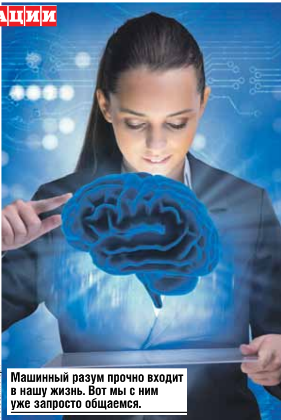
Машинный разум прочно входит в нашу жизнь. Вот мы с ним уже запросто общаемся.