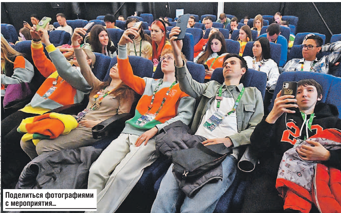
Поделиться фотографиями с мероприятия...