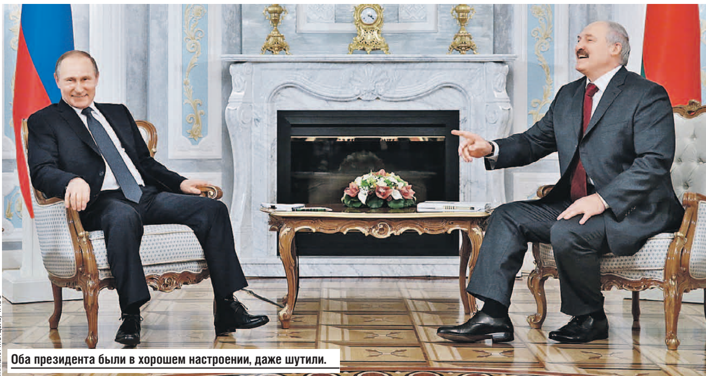
Оба президента были в хорошем настроении, даже шутили.

Президенты России и Беларуси провели в Минске Высший Госсовет