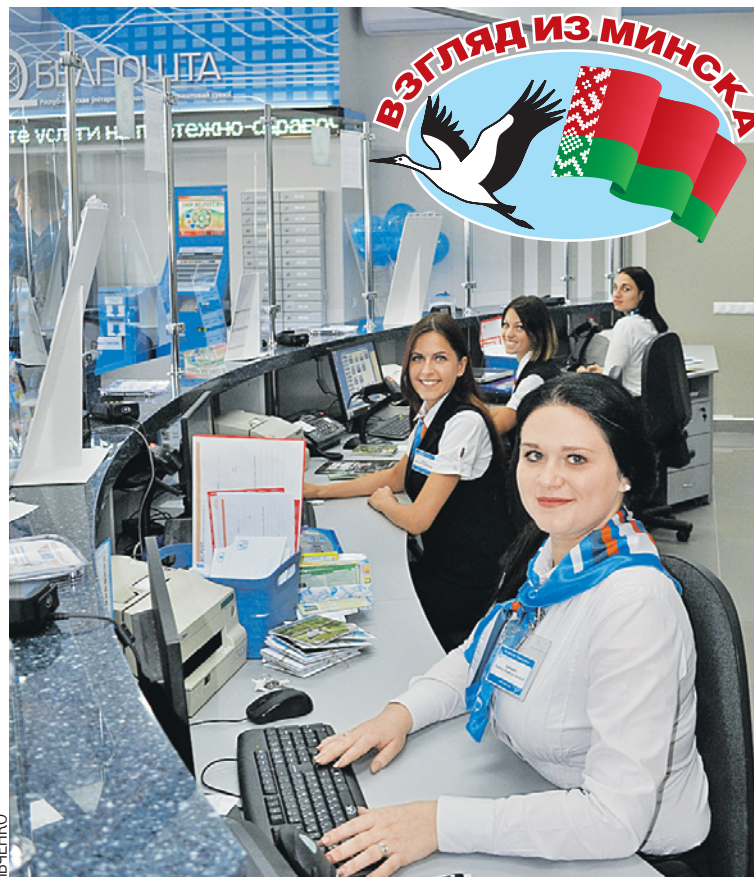
«У нас работают или неделю, или всю жизнь!» - говорят сотрудницы 48-го почтового отделения Гомеля.

В Беларуси установлен госстандарт по «частоте доставки почты». В районных центрах и агрогородках периодическая печать должна доставляться читателю не реже пяти раз в неделю.