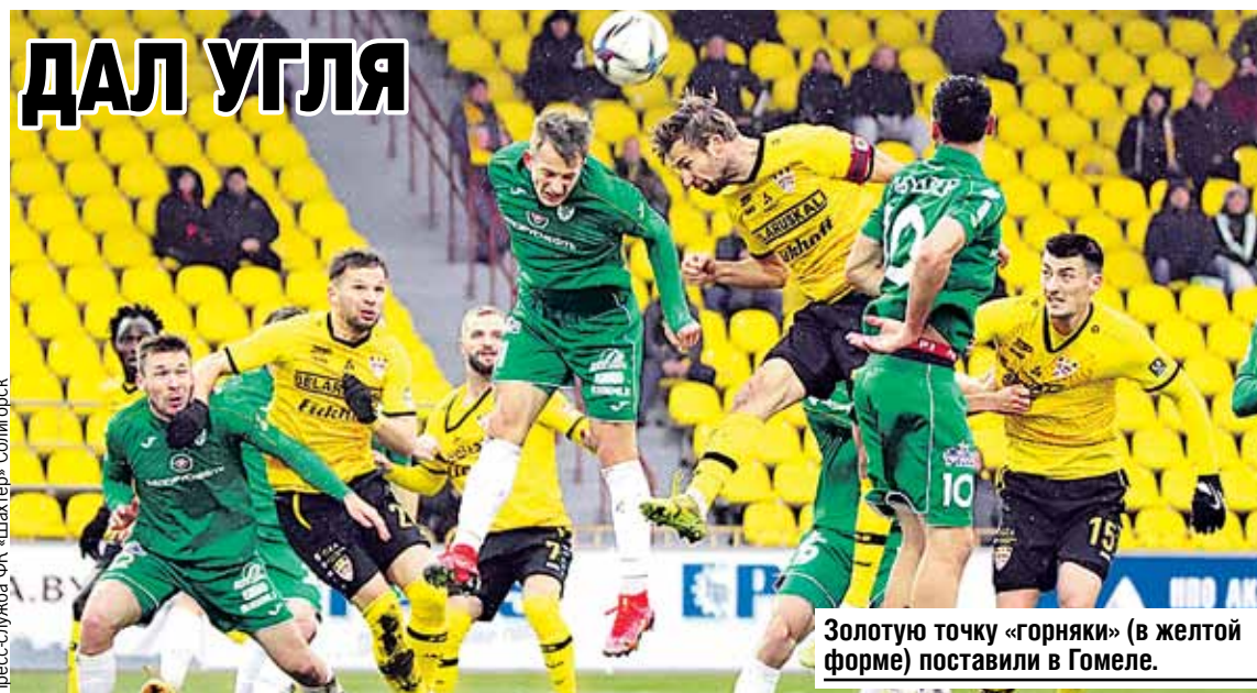
Золотую точку «горняки» (в желтой форме) поставили в Гомеле.

Парадокс, да и только. Столь частая тренерская чехарда ничего хорошего обычно не приносит. Ведь у каждого наставника свои подходы и видение игры. И каждый раз происходит своеобразная ломка, команда подстраива-